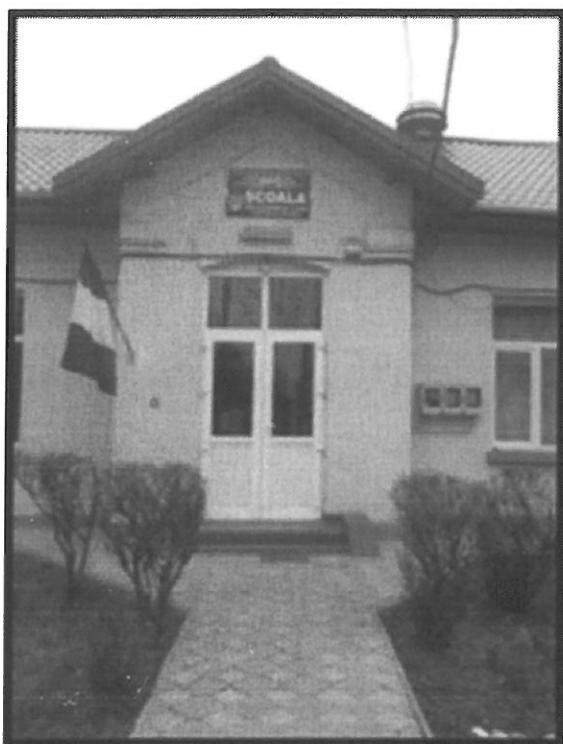
Școala Gimnazială Unirea